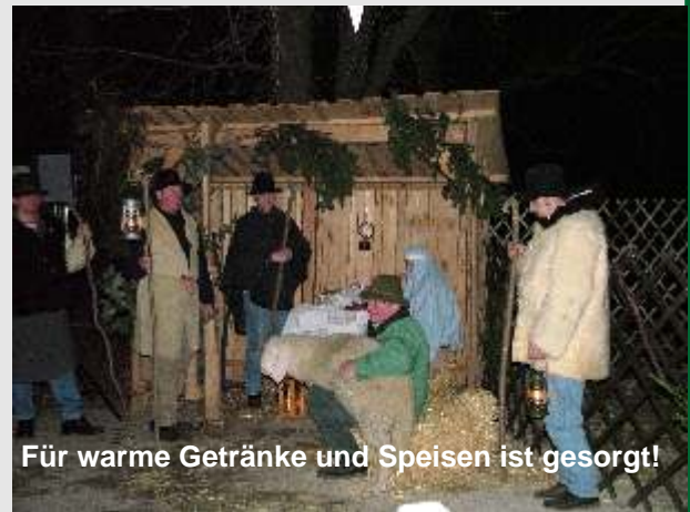
Für warme Getränke und Speisen ist gesorgt!

zum 17. Krippenspiel in den Pfarrhof nach Staatz ein.